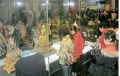
展覽會吸引大批市民參觀，對稀世奇珍興趣盎然。