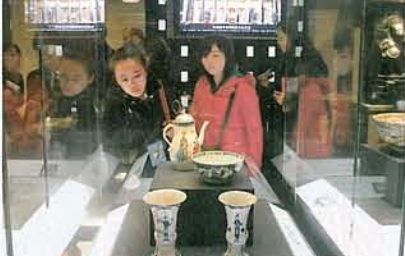
《青花仕女花瓶》於1760年英格蘭製造。