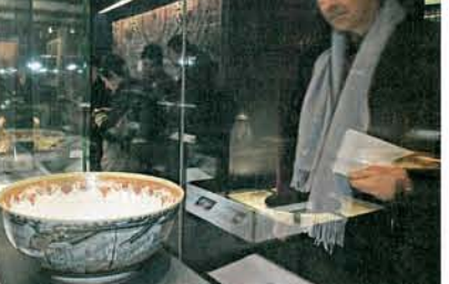
這工極為精緻的大碗，吸引參觀者專注研究。

大英博物館在北京故宮博物院的首次展覽正式揭幕，其中不少展品，更是流落在外的珍貴中國文物。以保護中國文化為己任的何東家族成員——何鴻毅家族基金主席何鴻毅，作為這次展覽贊助人亦隨進京。談到文物外流和中國內地盜墓情況猖獗的問題，這位文化衛護者不勝歎歎之餘，亦義憤填膺，愈講愈有火！