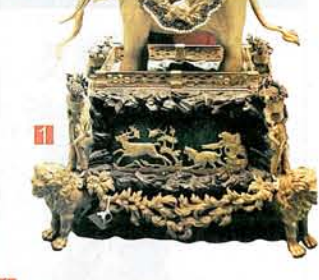
1 瑰麗精緻的網盤金象狀水法表。