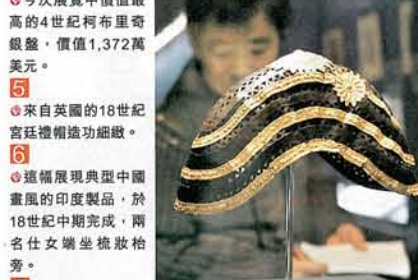
5 來自英國的18世紀宮廷禮帽細緻。