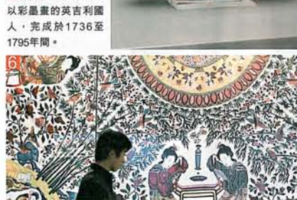
6 這幅展現典型中國畫風的印度製品，於18世紀中期完成，兩名仕女端坐梳妝枱旁。