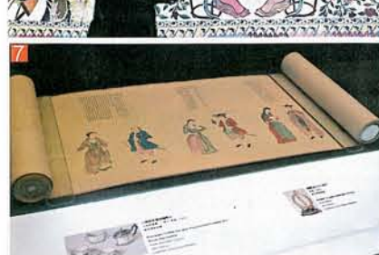
7 清代乾隆於絲綢上以彩墨畫的英吉利國人，完成於1736至1795年間。