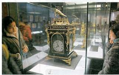
這個《木樓自鳴鳥頂四面鐘時鐘》，於18世紀英國製造，每逢報時鐘頂的鸚鵡會邊點頭邊鳴叫。